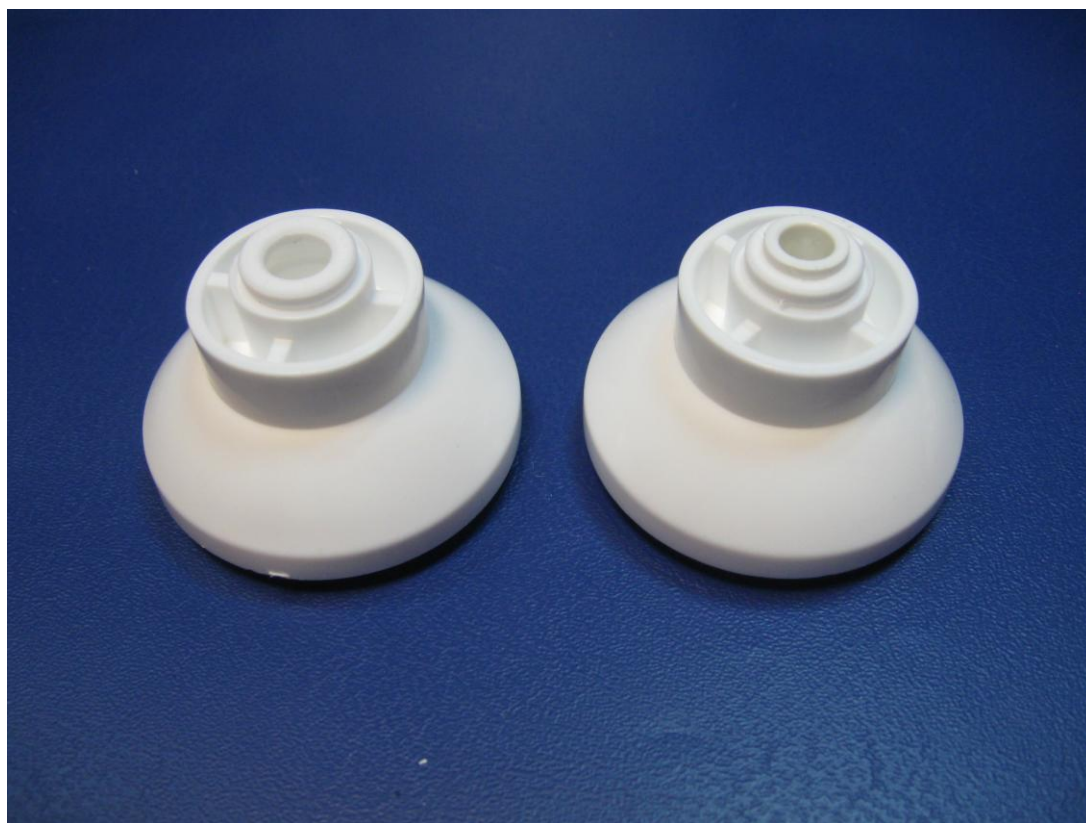
Zdjęcie nr 5: pokrywa mineralizatora 2" z wgrzanym pierścieniem i z zamontowanym szybkozłączem