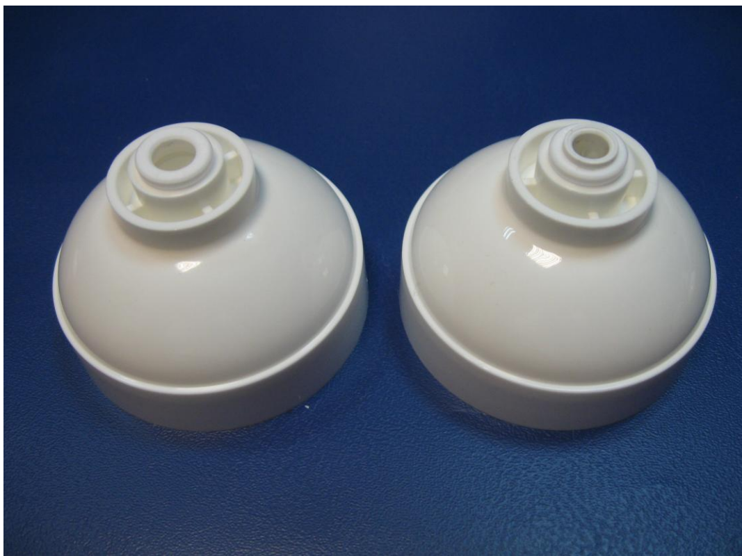
Zdjęcie nr 4: pokrywa mineralizatora 2,5" z wgrzanym pierścieniem i z zamontowanym szybkozłączem