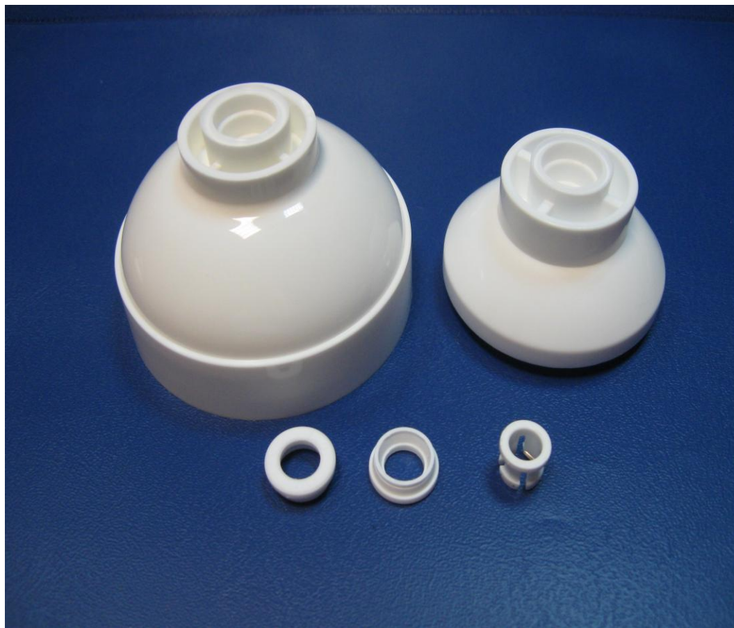
Zdjęcie nr 3: pokrywa mineralizatora 2" i 2,5"