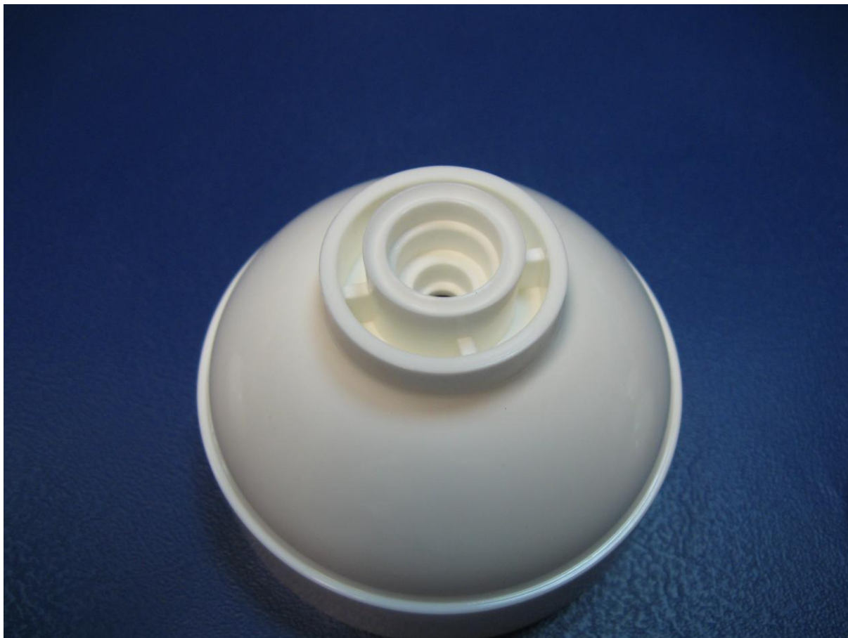
Zdjęcie nr 2: pokrywa mineralizatora 2,5"