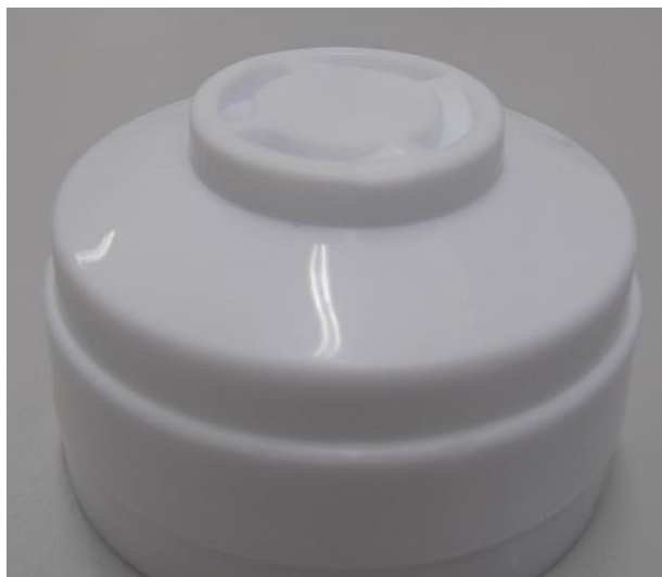
Pokrywa końcówka C – zaślepiająca;