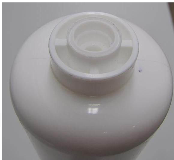
Pokrywa końcówka B – pod szybkozłączkę;