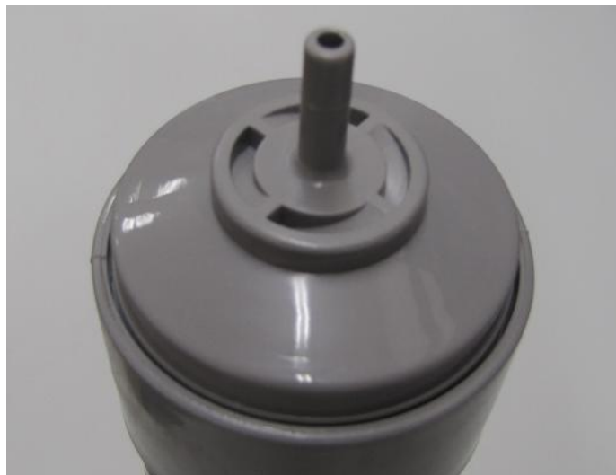
Pokrywa końcówka A - długość centralnego bolca 18,0 -22,0 mm; - średnica zewnętrzna bolca 5,8 – 7,0 mm; - pod standardową szybkozłączkę;