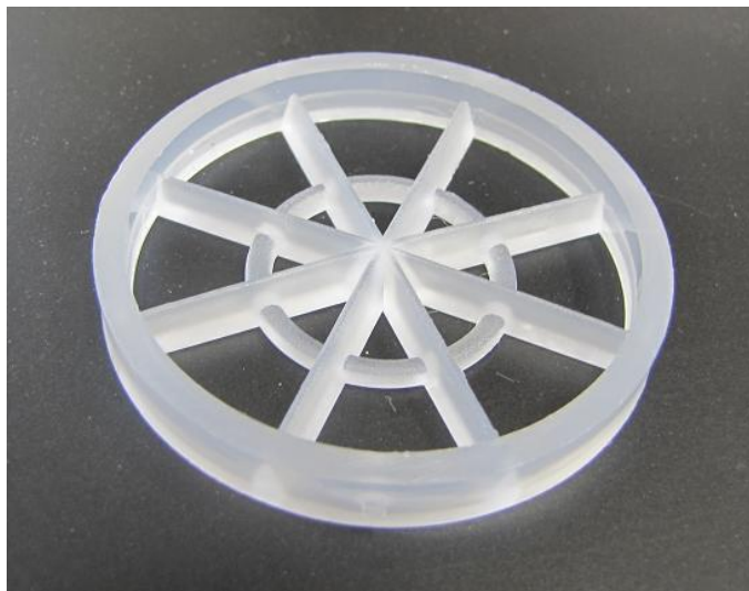
Kratka - średnica zewnętrzna 51,0-58,0 mm.