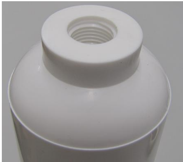
Korpus końcówka C – gwint ¼ cala;